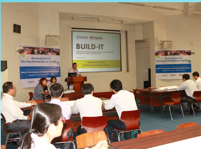
Buổi tập huấn trong Dự án BUILD-IT tại Trường ĐHCT.

Trong khuôn khổ Dự án BUILD-IT, trong hai ngày 11 và 12/9/2017, Trường ĐHCT tổ chức tập huấn cho cán bộ lãnh đạo, cán bộ chuyên trách các đơn vị hỗ trợ đào tạo và tổ đảm bảo chất lượng của các đơn vị đào tạo với sự tham gia tập huấn của hai chuyên gia của Dự án BUILD-IT. Nội dung của buổi tập huấn liên quan tới xây dựng và sử dụng bảng câu hỏi đánh giá học phần và tổng hợp, trình bày, nhận xét đánh giá dữ liệu kiểm tra, đánh giá người học nhằm nâng cao hiệu quả hoạt động đảm bảo chất lượng đào tạo tại Trường.