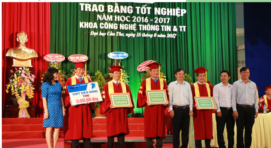
Đại diện lãnh đạo Khoa Công nghệ Thông tin và Truyền thông nhận biểu trưng học bổng từ các nhà tài trợ.

cử nhân và kỹ sư bước vào đời mưu sinh, lập nghiệp. Nhà trường mong muốn sinh viên Trường ĐHCT sau khi tốt nghiệp luôn giữ vững tinh thần học tập suốt đời, biết vận dụng những kiến thức đã học vào thực tiễn, từ thực tiễn tự làm phong phú hơn vốn tri thức của mình.