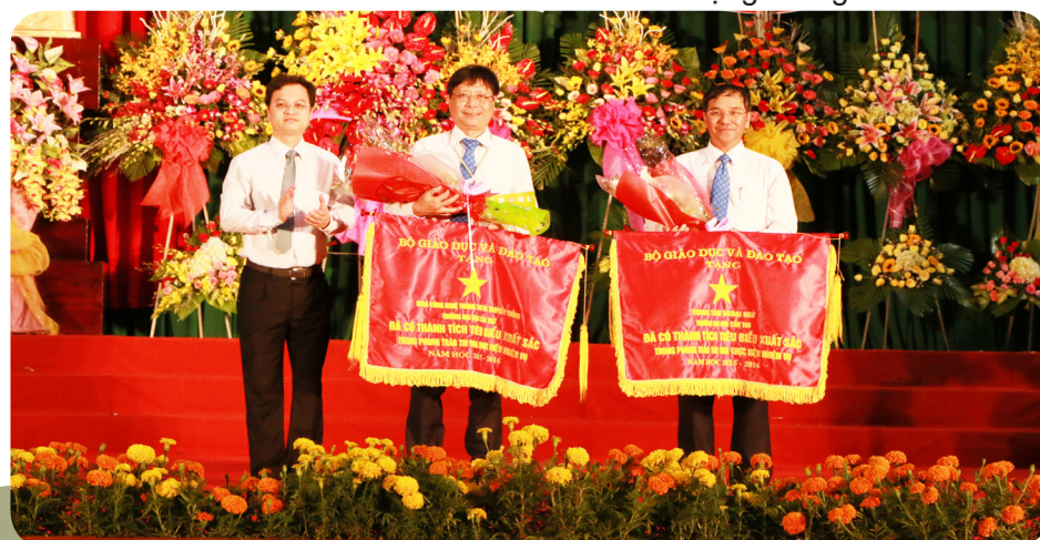
Khoa Công nghệ Thông tin và Truyền thông và Trung tâm Ngoại ngữ vinh dự nhận Cờ thi đua của Bộ vì có thành tích xuất sắc trong phong trào thi đua năm học 2015-2016.