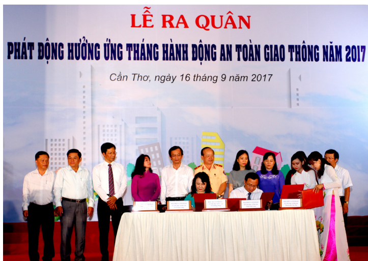
Ký cam kết giữa 5 sở GD&ĐT.

50.000 tỷ đồng, bằng 30% ngân sách giáo dục và 60% giá trị xuất khẩu lúa gạo, tương đương 1,5 triệu người không có thu nhập trong một năm. Vấn đề nói trên xuất phát từ nhiều nguyên