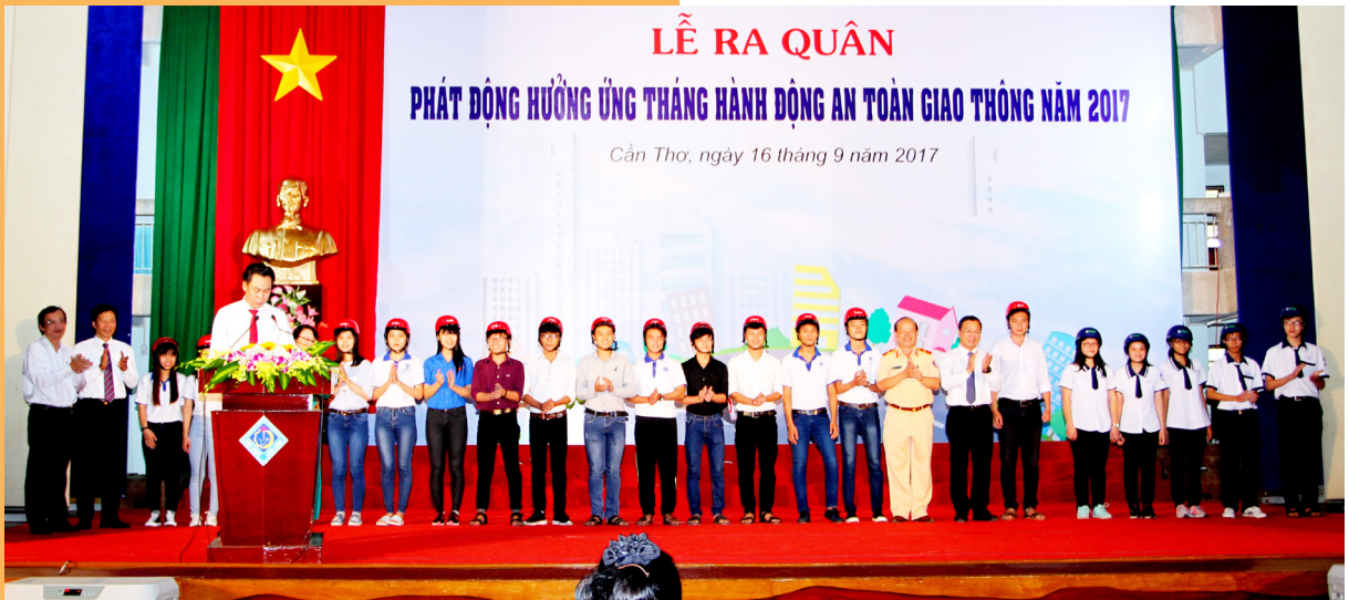
15 SV, 05 HS đại diện cho trên 1.000 HSSV nhận mũ bảo hiểm.

giáo dục ATGT, thực hành lái xe an toàn trên phạm vi cả nước, đặc biệt là những hoạt động gắn liền với HSSV. Tại buổi Lễ Honda Việt Nam, Công ty Cổ phần xe điện toàn cầu Pega đã trao