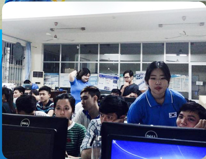
Các sinh viên được tham gia lớp lập trình Java và Android của nhóm tình nguyện.

Chương trình Tình nguyện viên Công nghệ Thông tin KIV là một dự án của Cơ quan Xã hội-Thông tin Quốc gia Hàn Quốc (National Information Society Agency-NIA) nhằm gửi các nhóm tình nguyện viên về công nghệ thông tin đến các quốc gia đối tác trong khoảng thời gian