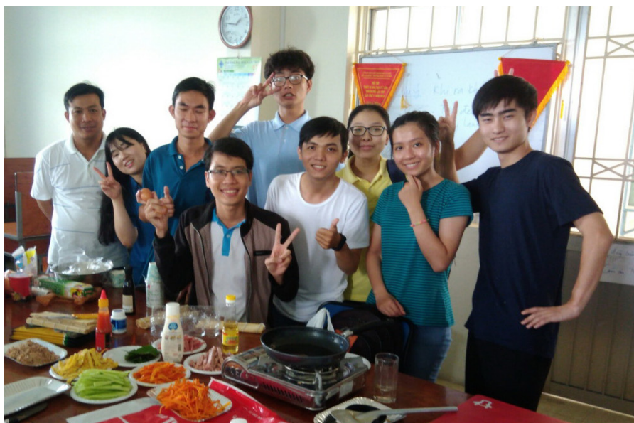
Sinh viên hào hứng trong giao lưu ẩm thực.

thông với chương trình IT & Culture Exchange Program.