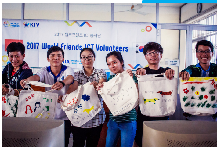
Sinh viên hào hứng tham gia cuộc thi thiết kế túi xách xanh.

Chỉ với bốn tuần lễ ngắn ngủi, nhóm tình nguyện viên và các sinh viên của Bộ môn Điện tử Viễn thông đã dành cho nhau khoảng thời gian tuyệt vời, sự hiểu biết lẫn nhau thông qua trao đổi văn hóa. Bỏ qua hết những rào cản ngôn ngữ, các bạn xích lại gần nhau hơn sau các buổi học, các buổi giao lưu văn hóa. Họ đã tạm biệt nhau vào ngày 30/08/2017 trong niềm lưu luyến và mong rằng hoạt động này sẽ diễn ra thường niên.