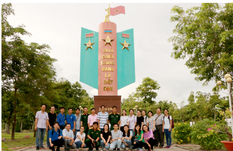
Đoàn chụp ảnh lưu niệm cùng các anh chiến sĩ Trung đoàn BB1.

nhân dân. Nhân kỷ niệm 50 năm ngày thành lập (23/9/1963 - 23/9/2013), Trung đoàn được tặng