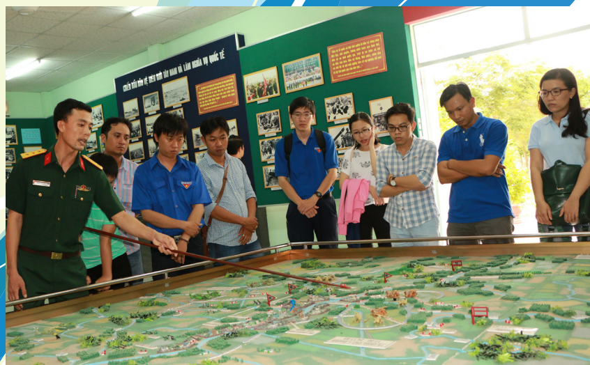
Cán bộ trình bày diễn biến tập kích Chi khu Chà Lã và đánh địch đổ bộ đường không, trận thắng tiêu biểu của Trung đoàn.

dựng, chiến đấu và trưởng thành, Trung đoàn BB1 đã được Đảng, Nhà nước 03 lần tuyên dương danh hiệu Anh hùng lực lượng vũ trang nhân dân vào các năm 1973, 1975 và 1989. Ngoài ra, Trung đoàn có 3 tiểu đoàn và 6 đại đội được tuyên dương danh hiệu Anh hùng lực lượng vũ trang nhân dân, trong đó Tiểu đoàn 309 và Đại đội 11 được tuyên dương 02 lần, có 19 cá nhân được phong tặng danh hiệu Anh hùng lực lượng vũ trang